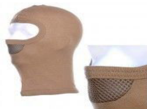
Bivak muts mesh