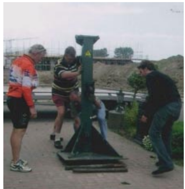
Alles loopt op rolletjes