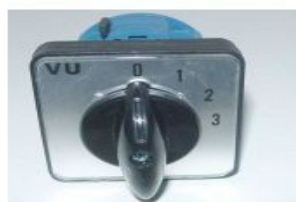
Draaischakelaar 20Amp LW26-20