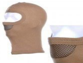
Bivak muts mesh