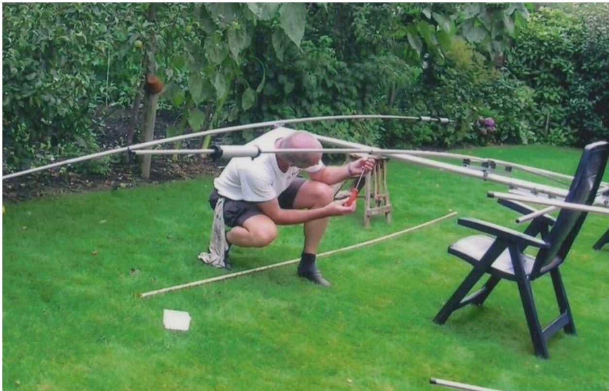
Straks boven in de mast lijkt zo'n antenne veel kleiner