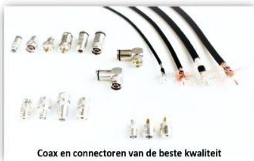
Coax en connectoren van de beste kwaliteit