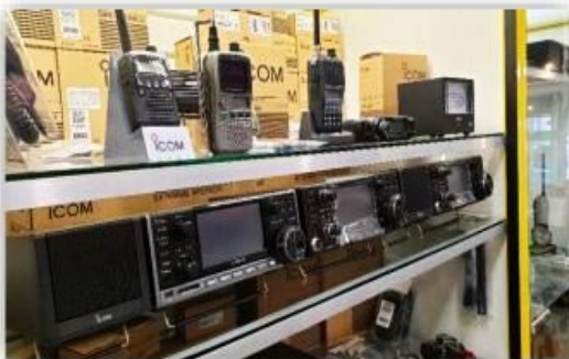
Een van de ICOM vitrines in onze winkel

Onze webshop zal de komende maanden steeds een stukje verder uitgebreid worden, zodat alle artikelen ook online vindbaar zijn. Vindt u online niet wat u zoekt? Bel, WhatsApp of mail ons gerust. Wij hebben dit mogelijk in voorraad of kunnen dit snel leveren. Uiteraard voor de beste prijs!