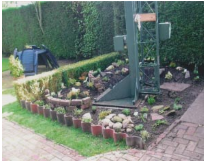
De groene mastvoet heb ik nog verder wat gecamoufleerd met perken met plantjes