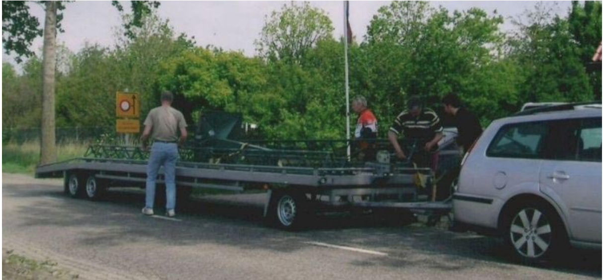
Totaal meer dan 20 meter lengte

even aan moet wennen als je daarmee de weg op gaat. Al vroeg op een zaterdagmorgen op pad gegaan. Ergens in een klein dorp in Limburg moest ik nog wel door de winkelstraatje een flink stuk op de linker weghelft gaan rijden om de bocht naar rechts te kunnen maken.