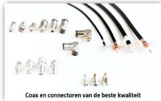
Coax en connectoren van de beste kwaliteit