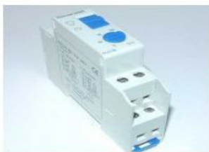
Trappenhuis licht timer schakelaar ALC18