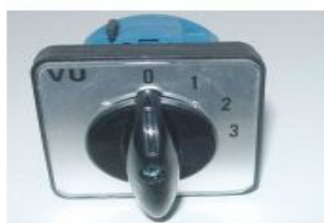
Draaischakelaar 20Amp LW26-20