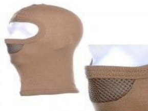
Bivak muts mesh