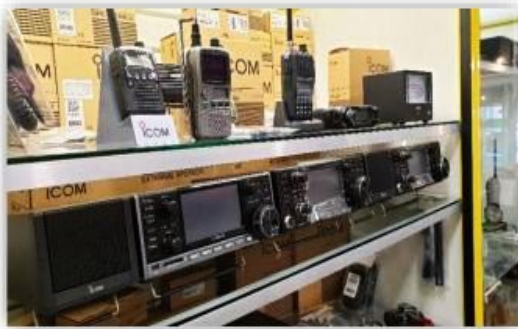
Een van de ICOM vitrines in onze winkel

Onze webshop zal de komende maanden steeds een stukje verder uitgebreid worden, zodat alle artikelen ook online vindbaar zijn. Vindt u online niet wat u zoekt? Bel, WhatsApp of mail ons gerust. Wij hebben dit mogelijk in voorraad of kunnen dit snel leveren. Uiteraard voor de beste prijs!